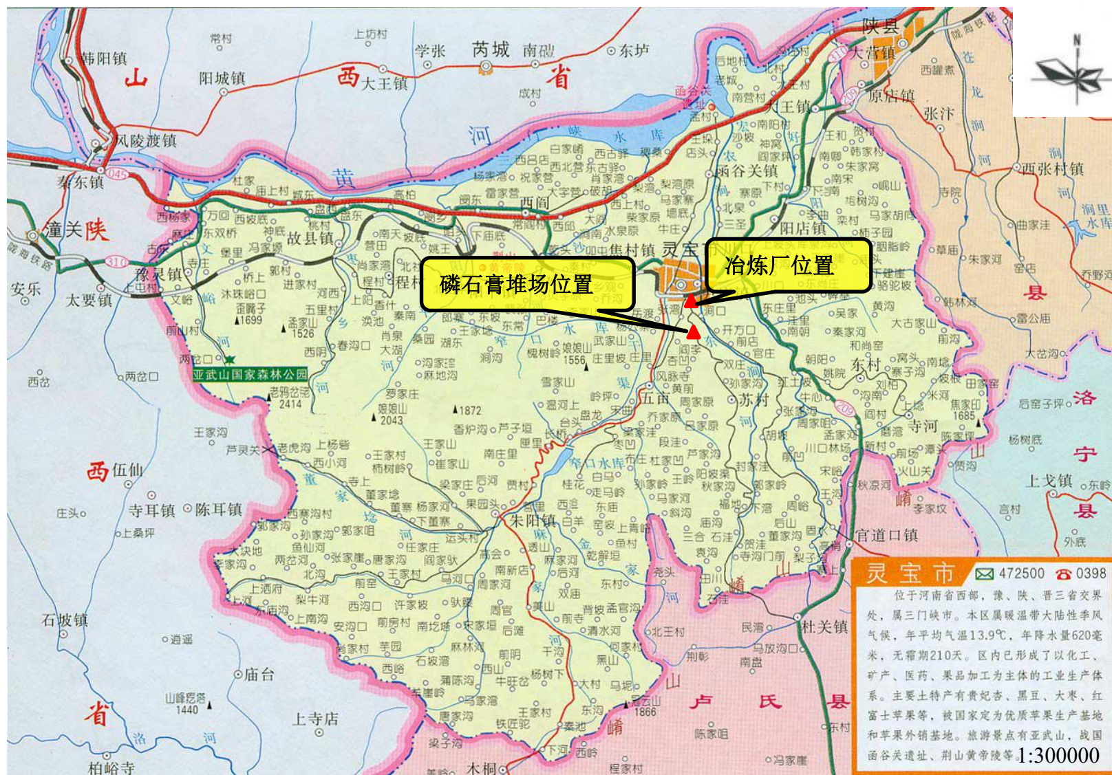
附图1 项目地理位置图